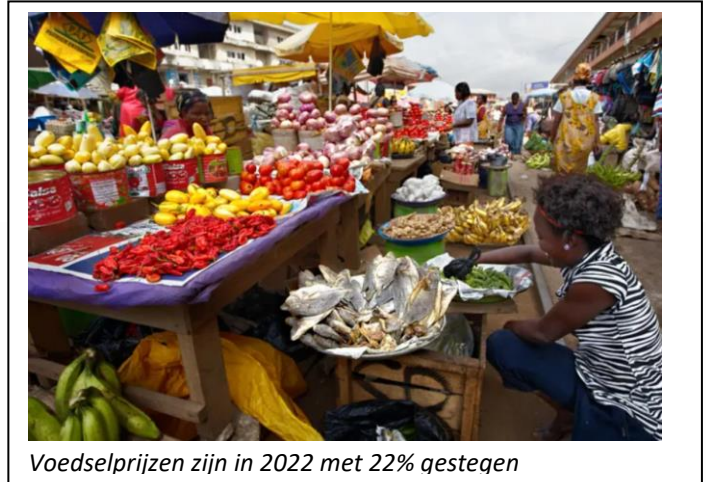
Voedselprijzen zijn in 2022 met 22% gestegen

De wereld is zo aan elkaar verbonden dat crisis in Europa automatisch ook crisis betekent voor Afrika. Dus ook in Ghana. En binnen Ghana lijdt het Noorden weer meer dan het Zuiden. Hoewel de corona crisis nu over is, zijn de naweën in Noord Ghana nog steeds aanwezig. Corona legde het transport van Zuid naar Noord Ghana stil van brandstof, voedsel, landbouwbenodigdheden zoals kunstmest en veroorzaakte daar een voedseltekort. Maar het veroorzaakte ook, als positief bijeffect, een run op de compost activiteiten van onze project-partner Issifu van CEAL in Walewale. In de December 2021 nieuwsbrief hebben we hierover geschreven (op onze website is dit nog na te lezen).