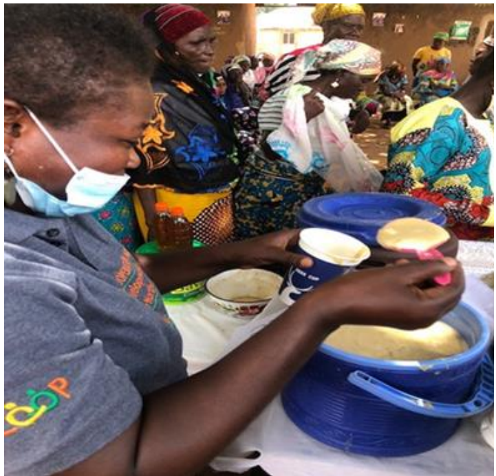
De Mother 2 Mother in actie!

Crisis betekent letterlijk 'Ommekeer', en dit zien we gebeuren en we zijn dankbaar dat we aan de ommekeer bij kunnen dragen!