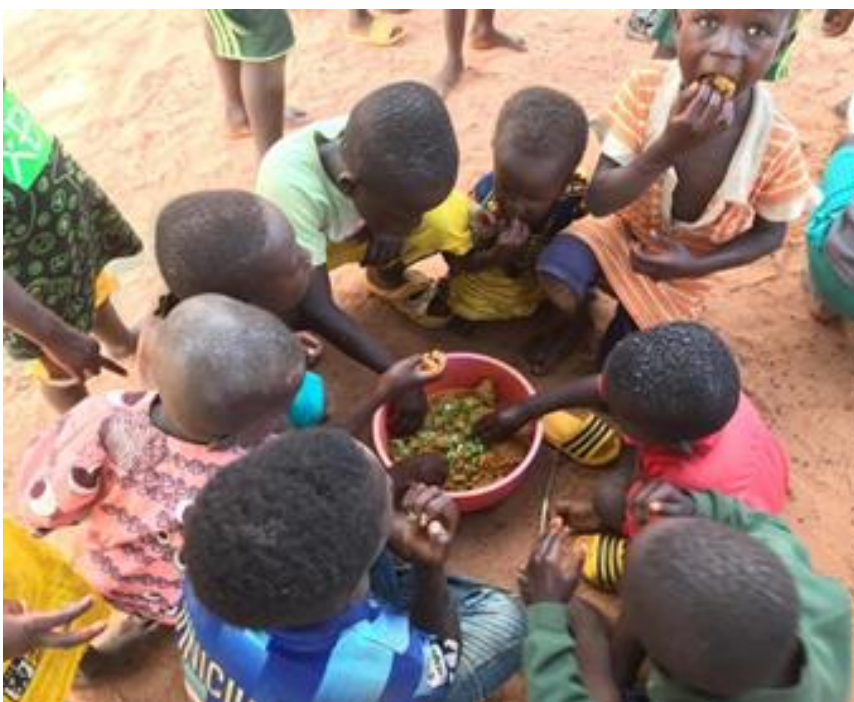
Kinderen eten een heerlijk papje met groente!