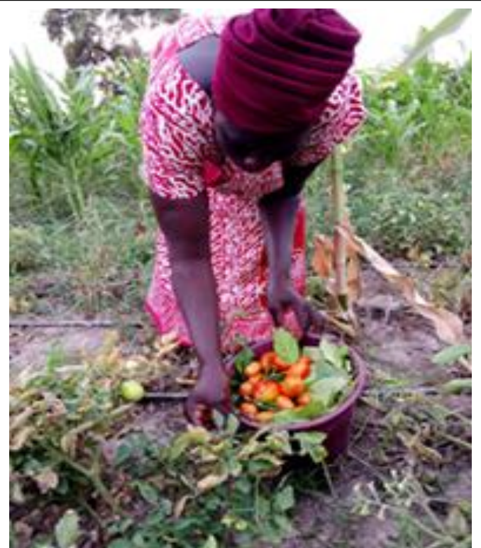
Een rijke oogst aan groente

CEAL en Pumping=Life komen met een nieuw plan voor het druppelirrigatieproject voor 2023.