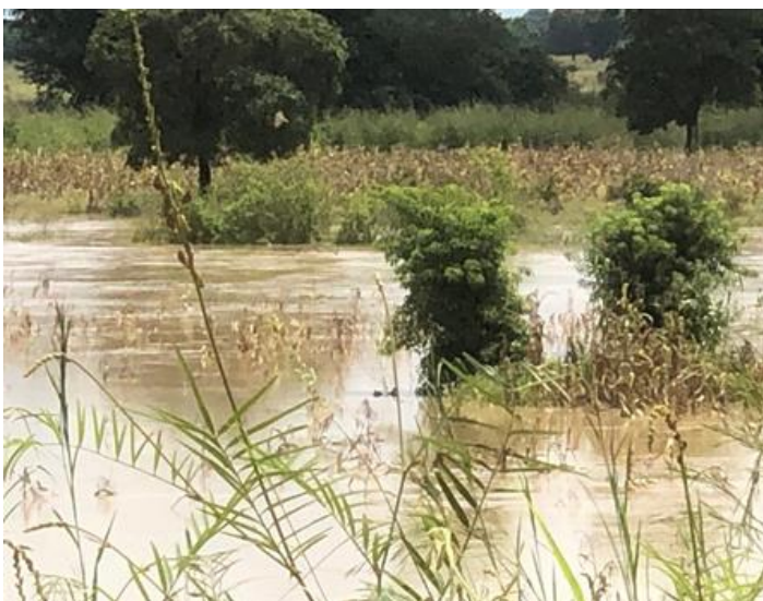
Deze mais is vernield door overstromingen

Eén gemeenschap, Dbisi, heeft belangstelling getoond en het dorp kwam met de volgende oplossingen: