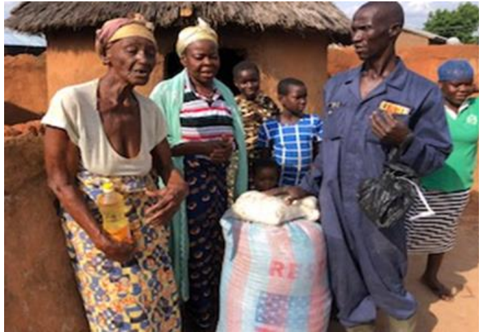
Nood hulp zal weer nodig zijn in het komende 'hongerseizoen'

In september 2020 waren er grote overstromingen langs de Volta rivier in Noord Ghana. Deze werden veroorzaakt door hevige regenval en door het openzetten van de Bagre stuwdam net over de grens in Burkina Faso. We hebben toen € 15.000,- noodhulp kunnen organiseren door een crowdfundingactie. Het geld is gebruikt om arme huishoudens voedsel te geven om het hongerseizoen door te komen en bouwmaterialen om hun huizen te herbouwen. In 2021 waren er gelukkig geen overstromingen, maar helaas in september en oktober van dit jaar waren er opnieuw overstromingen. Issifu vroeg weer om noodhulp om vooral voedsel te kunnen kopen voor de huishoudens die hun mais overstroomd zagen door water en dus voor het komende seizoen geen voedsel hebben. Er is € 5.000,- overgemaakt om, nu in het oogstseizoen het voedsel nog relatief goedkoop is, al