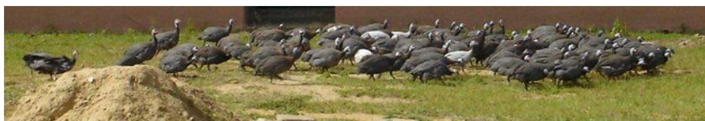
Parelhoenders van GIOF

De ELPG steunt deze school samen met de Stichting EOF ( http://www.eofghana.org/ ). De opstart van GIOF vraagt nog steeds veel overleg en begeleiding. Dit is vooral zo omdat voor de toekomst van de opleiding de inbedding in het Ghanese schoolsysteem erg belangrijk is. Voor het starten van een volledige opleiding komt veel kijken. Gewerkt wordt aan erkenning van de school en van de diploma's die zullen worden behaald. Die erkenning moet van de Ghanese overheid komen en dat vergt meer tijd dan werd verwacht. Gelukkig is er een heel goede samenwerking tot stand gekomen met de