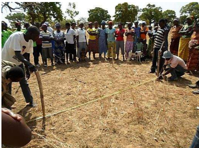
Boeren leren om compostkuil op te meten

In het dorp Kandiga, niet ver van Sirigu, zijn 85 boeren (m/v) opgeleid in het maken van compost.