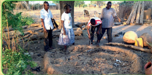
Dorpelingen in Sirigu maken compost