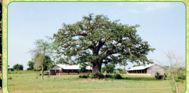
Baobab op terrein van Ghana Institute of Organic Farming (GIOF) in Sirigu