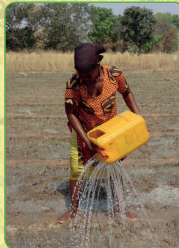
Vrouw uit Zasilari irrigeert het land