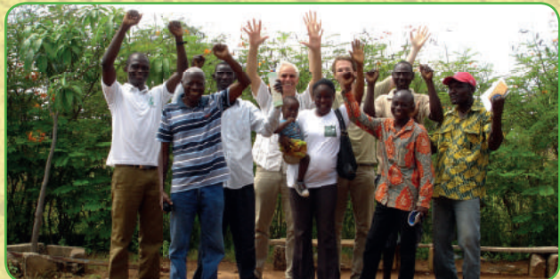
Het team van Zasilari tijdens bezoek van twee bestuursleden