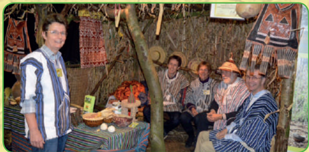
Bestuur in acties tijdens de biobeurs

Negen bestuursleden zetten zich op vrijwillige basis in voor ELPG. Bestuursleden hebben werkervaring in duurzame landbouw en/of ontwikkelingssamenwerking. ELPG is actief op conferenties, markten en beurzen en verzorgt lezingen en presentaties.